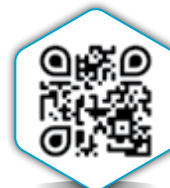
مرکز فابا در یک نگاه

تجربیات ارزنده ۱۵ سال فعالیت مستمر مرکز فابا و استقبال گرم اکوسیستم صنایع مالی، بانکی، پرداخت و فناوری از خدمات این مرکز، شرایط و انتظارات را برای ارتقاء سطح خدمات و برنامه‌های آن فراهم کرده است. از این رو در آغاز قرن پانزدهم هجری شمسی و پانزدهمین سال فعالیت «مرکز فابا» برنامه‌های متنوعی تحت عنوان «هفت مسیر فناوریانه» تدارک دیده شده است.